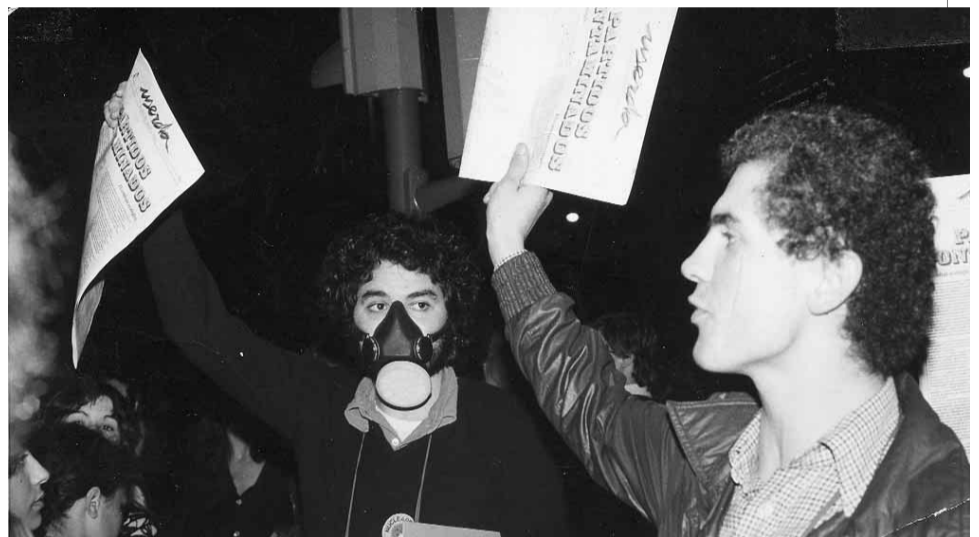
LA REVISTA S'OFERIA A LA SORTIDA DELS ACTES POLÍTICS I A LES MANIFESTACIONS.

Després d' Userda i de l'experiència autogestionària de Diario de Barcelona , van venir uns quants anys de silenci, fins a la creació el 1996 de l'associació Una Sola Terra. Mentrestant, havia sorgit una associació de periodistes especialitzats en informació científica i ambiental amb clara vocació gremialista i de no trepitjar els ulls de poll de les grans empreses del sector químic i energètic de les quals re-