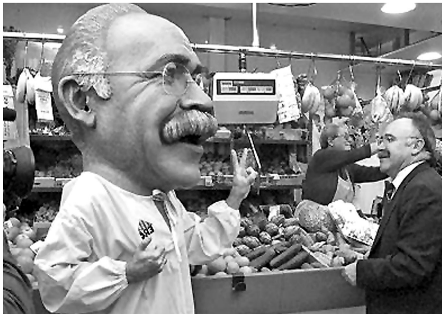
EL NINOT DE JOSEP-LLUÍS CAROD-ROVIRA, EXMEMBRE DE NE ARA A L'ESTRELLAT D'ERC.

A finals dels setanta es va configurar a Catalunya un nou pensament basat en l'essència del que avui vol ser el moviment antiglobalització. Alguns dels que pertanyiem a aquells grups antisistema i que havíem decidit fer acció política vam optar